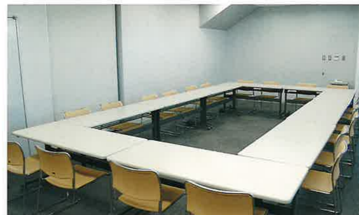
■会議室 OHPスクリーンが設置され、研修室、控え室等に利用できます。また、移動間仕切りによる分室も可能です。