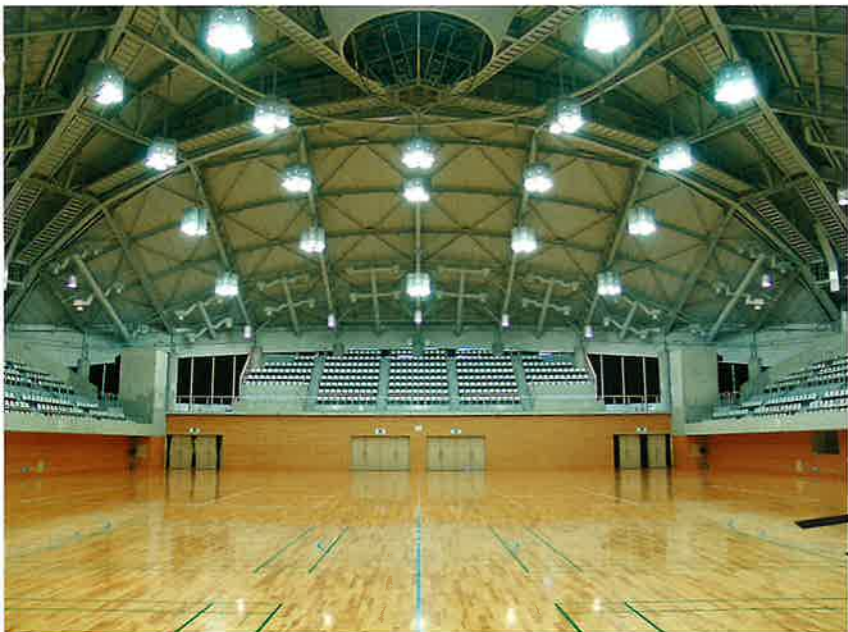
■体育室 面積は1,900㎡で、バスケットボール2面、テニス3面、バレーボール3面、バドミントン12面、ハンドボール1面のコートがとれます。また2,000席(固定式)の観客席があります。

健康の保持増進に対する関心の高まりとともに、多様化・個性化するスポーツニーズに対応し、市民の誰もが豊かなスポーツライフの実現を目指す体育施設として、三協アルミニウム工業株式会社より寄付を受けた本施設を、スポーツ・レクリエーション拠点として新たに開設しました。