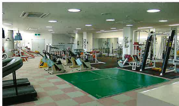
■トレーニング室 健康増進と体力強化が目的で、カウンセリングによる個人別のメニューに基づいた計画的・科学的なトレーニングが行えます。