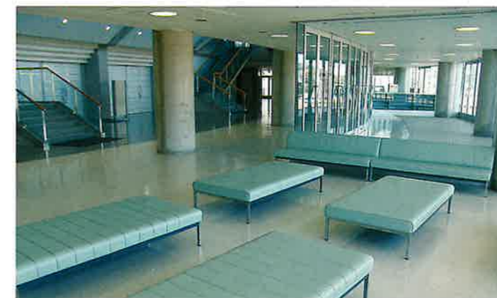
■ラウンジ 落ち着いた雰囲気の中で、ゆっくりと休憩、歓談が楽しめます。