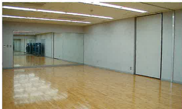
■多目的室 エアロビクス、ヨガ等の利用に対応するため弾性床を使用。テーブル・椅子の設置によって50席までの研修室、控え室にも利用できます。また、移動間仕切りによる分室も可能です。